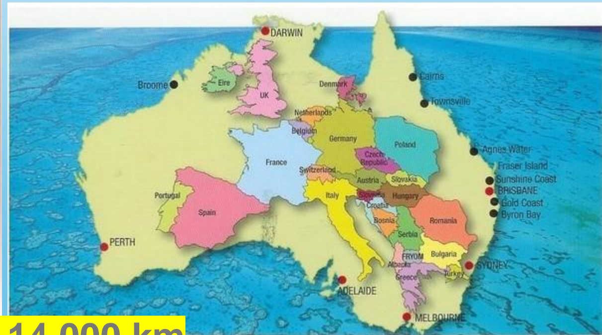
Australia and Europe Area size comparison Darwin to Perth 4396km · Perth to Adelaide 2707km · Adelaide to Melbourne 726km