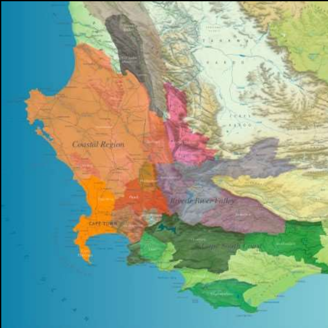
South Cape Cast