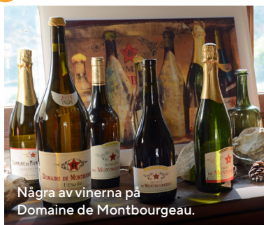
Några av vinerna på Domaine de Montbourgeau.