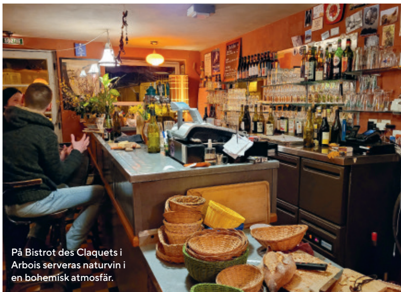
På Bistrot des Claquets i Arbois serveras naturvin i en bohemisk atmosfär.

TEXT | JOHAN WADMAN OCH RICKARD ALBIN